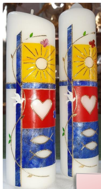
Drei Fenster 257-35-10 / 257-09-10