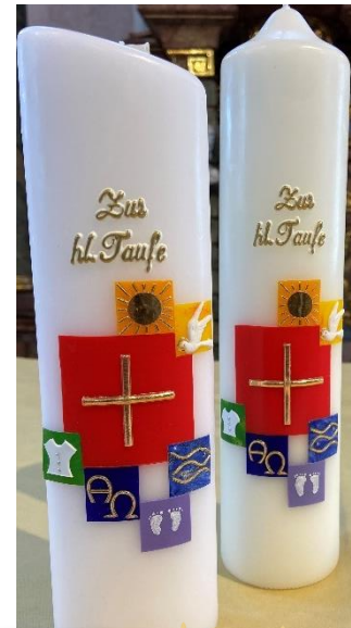
Sieben Symbole (Taufe) 258-35-10 / 258-09-10