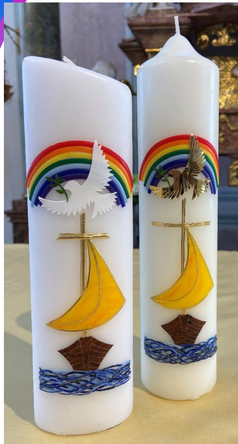
Arche Noah 204-35-10 / 204-09-10